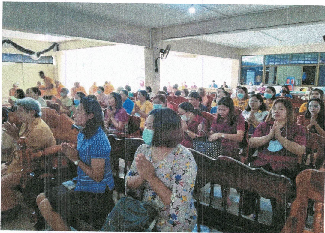
พนักงานเจ้าหน้าที่เทศบาลตำบลคลองใหญ่ร่วมกับประชาชนในพื้นที่ ร่วมฟังพระธรรมเทศนา ณ วัดตะโหมด