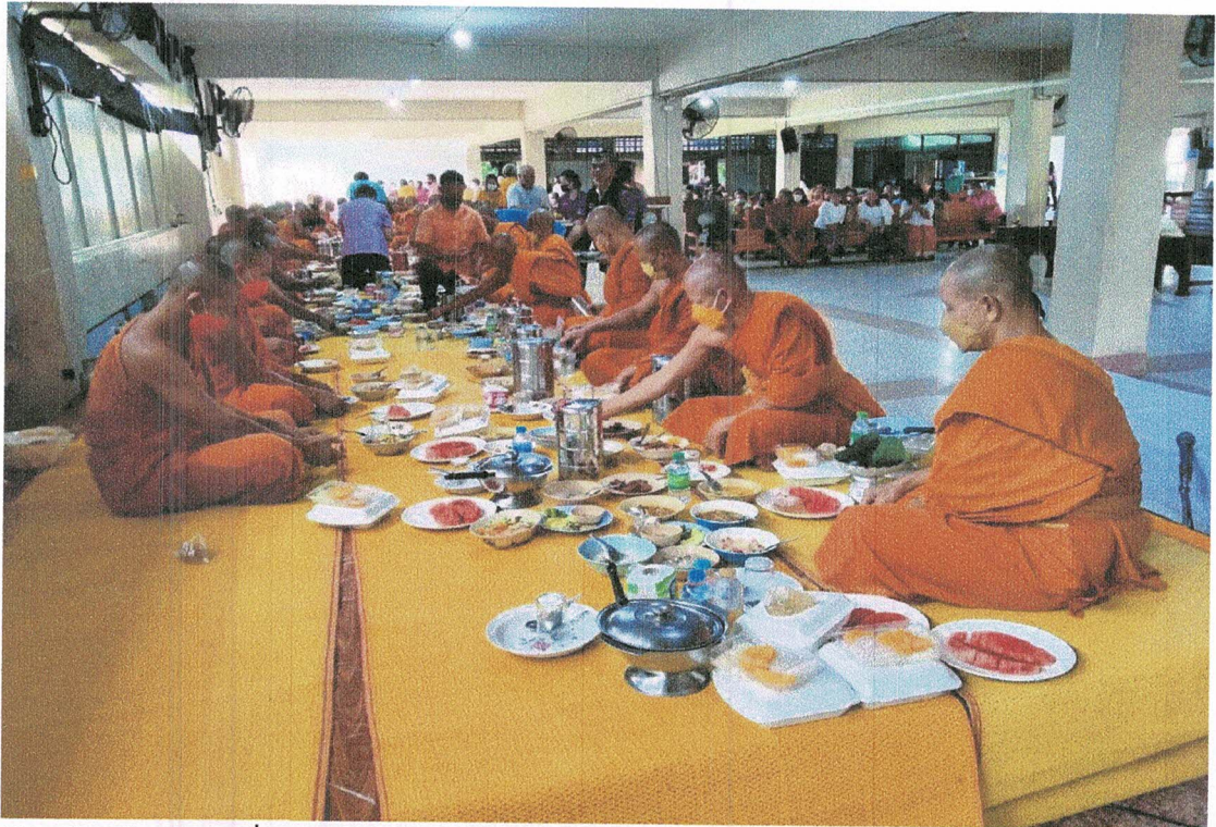
จัดเตรียมภัตตาหารเพื่อถวายแด่พระภิกษุสงฆ์